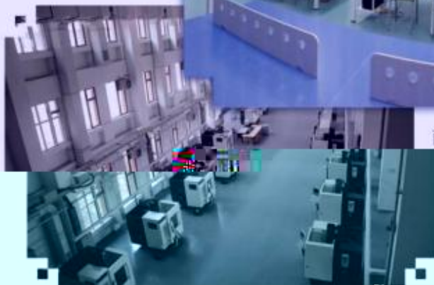
DMG 数控技术训练场所